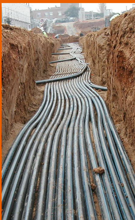
Collegamento delle sonde geotermiche ai collettori principali