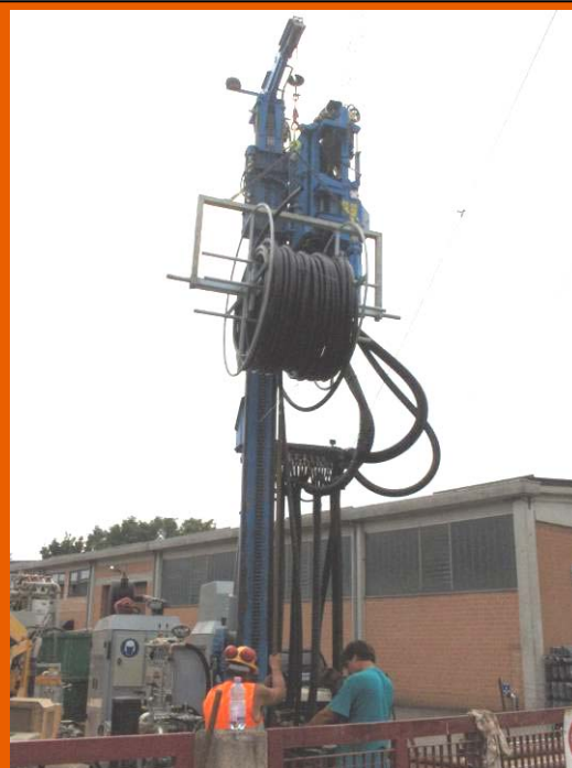
Inserimento della sonda all'interno del foro