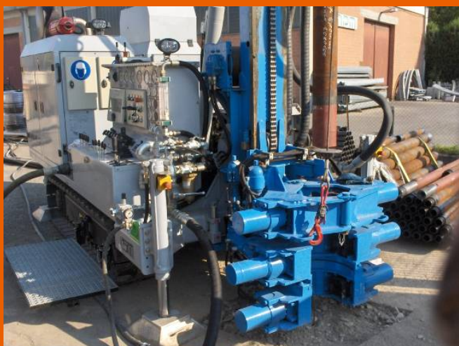
Sonda durante la fase di perforazione