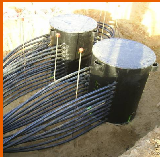
Collettori principali di mandata e ritorno